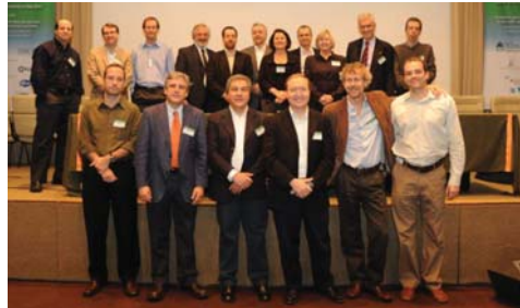
Científicos de Argentina, Brasil, Chile, España, Canadá, Estados Unidos y Suecia, entre otros países, se reunieron en la FIL. En la foto, algunos de los expositores

Con el apoyo clave de la Sociedad Internacional para la Investigación en Células Madre (ISSCR), se realizó en el Instituto Leloir el Simposio Internacional sobre Investigación en Células Madre, con la participación de 400 científicos de diferentes países. Organizado por el Ministerio de Ciencia, Tecnología e Innovación Productiva y co-organizado por el Instituto Leloir y la Fundación FLENI, el encuentro fortaleció el avance de esa área de investigación tanto en la Argentina como en la región. La apertura formal estuvo a cargo de la pre-